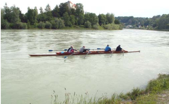
„Los geht's!“ ... im Hintergrund Burghausen