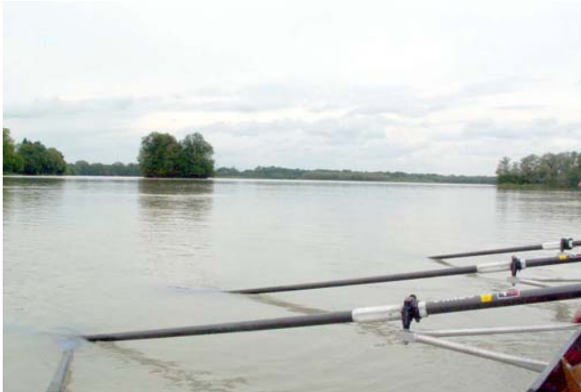
Naturschutzgebiet am Inn