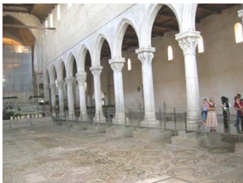
← Die Patriarchalbasilika von Aquileia hat berühmte Bodenmosaiken.