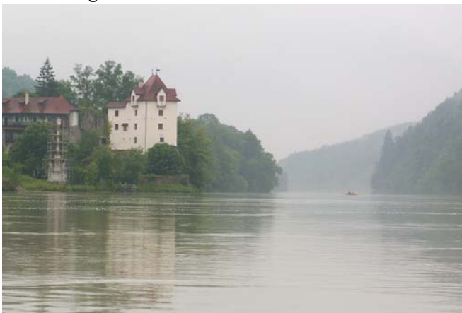
Schloss Wernstein am Inn