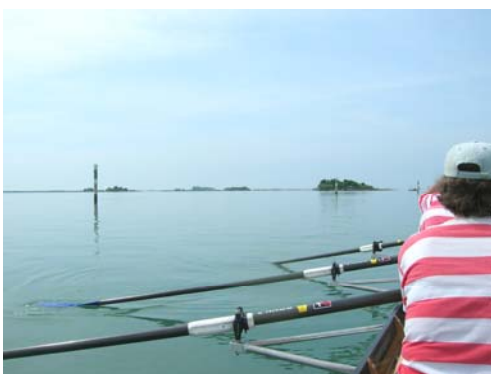
Frei schweift der Blick über die Lagune. Die Fahrhinne ist mit Dalben ausgeflockt.

Die Gezeitenströmung kann manchmal beträchtlich sein, und gesellt sich auch noch Gegenwind dazu, wird man sportlich voll gefordert. Während es am Vormittag in der Regel windstill ist, kommen am Nachmittag meistens Wellen auf. Besonders bei den Verbindungsstellen der Lagune zum offenen Meer bläst der Wind kräftig in die Lagune herein, und Wellen steigen ein. Hier tut man gut daran, eine Handlenzpumpe an Bord mitzuführen.