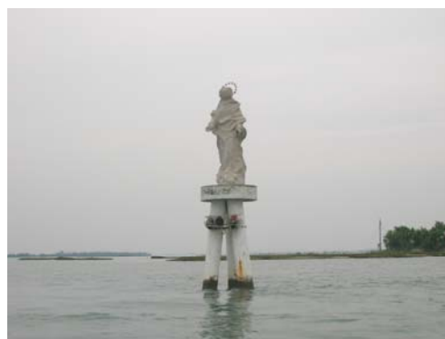
Auch eine Madonna zum Schutz der Seeleute darf nicht fehlen