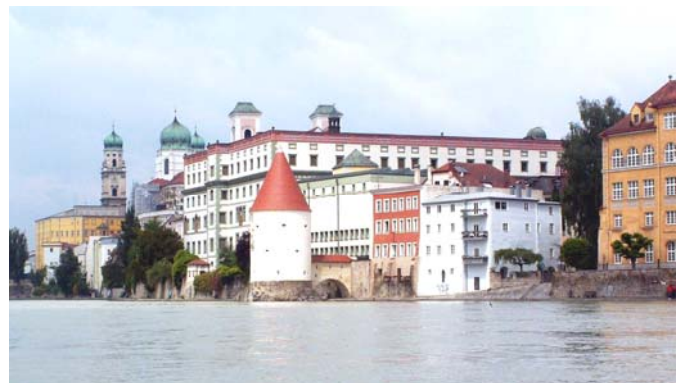
Passau im Sonnenschein

Und spätestens das vielstimmige mittägliche Glockengeläute von Passau begeisterte uns bei bereits heiterem Himmel so sehr,