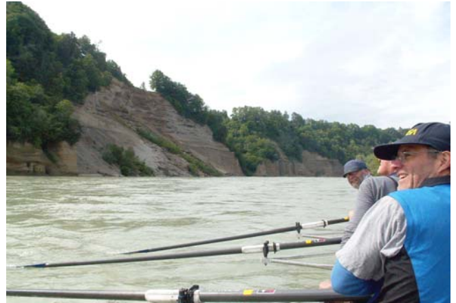
in rasender Fahrt die Salzach hinunter