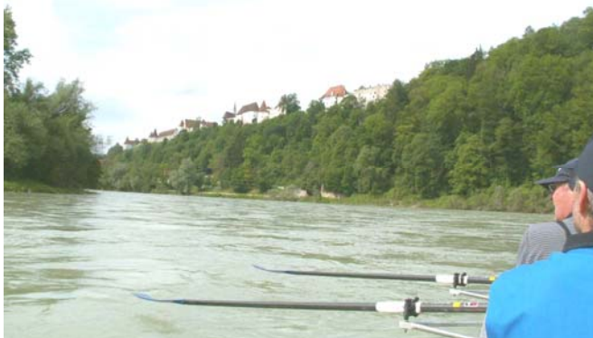
Start in Burghausen

(diesmal per Bahn (!!)) bis Schärding, dann per Taxibus nach Burghausen / Inn), durften wir bereits ab dem Aufriggern der Boote zu Füßen der mächtig-imposanten Felskulisse von Burghausen im Sonnenschein frohlocken.