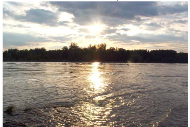
Aus der Serie „die schönsten Sonnenuntergänge“: Pfungstsamstag in Schärding