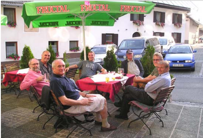
Schlagwort "Osterweiterung": auch wir gehen mit der Zeit und geben uns schon mal in den Süden ...