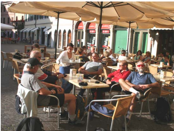
Nach einer durchwachsenen Regenettepe über den eindrucksvollen Vrsic-Pass ( SH 1.611 m ) empfängt uns der programmierte abendliche Sonnenschein in Cividale und ...