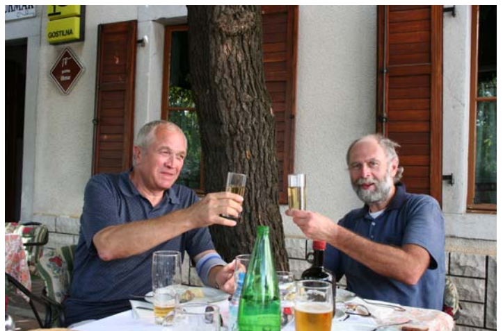
... bis unsere Rettung in Form einer Gostilna in Dutovlje mit dem lebensnotwendigen Prosecco uns wieder in den Sattel hilft ! Dann aber in halsbrecherischem Ritt über eine 9 km lange schnurgerade Schotterpiste nach Lipica und weiter nach Triest .