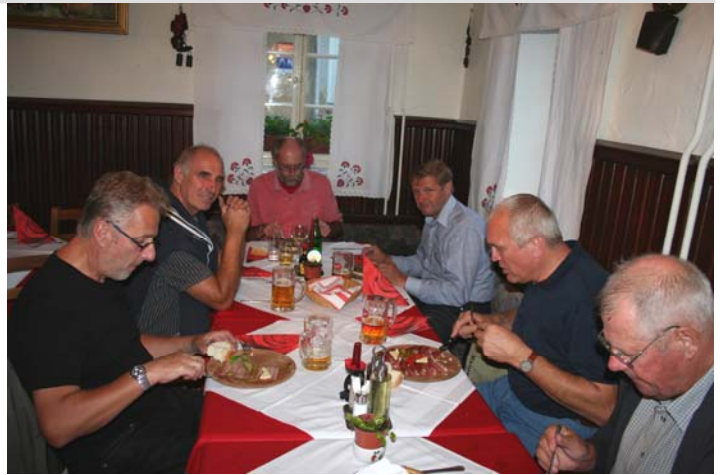
... wo es gleich vielversprechend im lieblichen Podkoren zu Füßen des Triglav beginnen sollte.