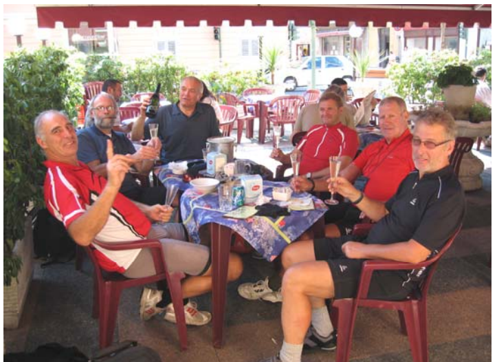
... so lassen wir's uns gefallen und fallen nächstens tags auch gleich in Görz ein, wo so manche Flasche hervorragenden Prosecco's uns die nötige Power für die Durststrecke durch den Karst verschaffen sollte .