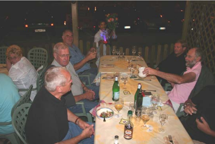
Am Etappenziel in Muggia wird's dann auch noch romantisch ( vielleicht auch nur durch die Kombination aus Sonnenstich und Prosecco ? ); wie auch immer, ...