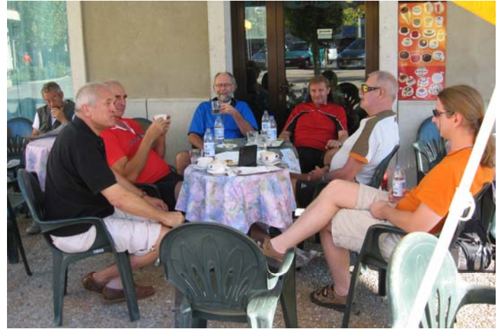
... der Cappuccino und die Brioche zum Frühstück sind erwartungsgemäß hervorragend und so schaffen wir auch die gefürchtete Rolleretappe entlang der Küste nach Piran.