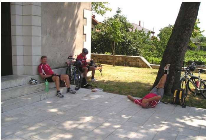
Das hier sieht nicht nur nach einem mittleren Ast aus, das war auch wirklich eine Hammer-Etappe: kein Wirt weit und breit, einfach nichts, außer wunderschöner Landschaft und Sonne und Steine soweit das Auge reicht, ...