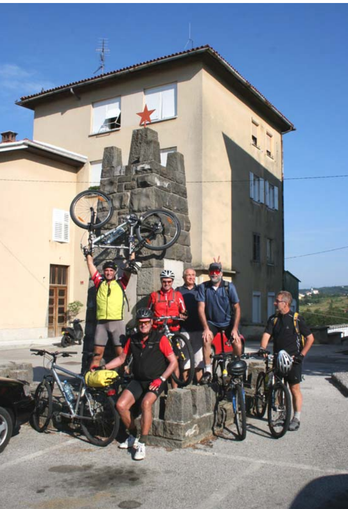
Ach ja: die Räder hatten wir auch mit !!! Und in Dobrovo durften wir sogar noch mit einem nostalgisch-gepflegten Roten Stern posieren.