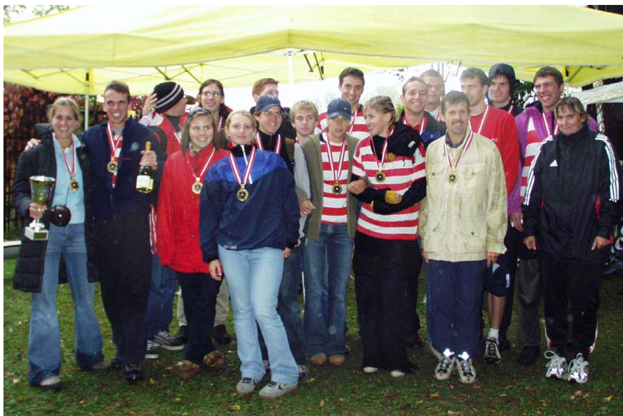
DIE SIEGREICHE MANNSCHAFT LIA 1 DER ÖSTERREICHISCHEN VEREINSSTAATSMEISTERSCHAFT 2003

– MITGLIEDERZEITSCHRIFT DES ERSTEN WIENER RUDERCLUBS LIA –