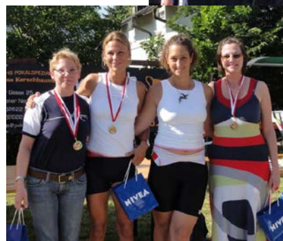
MWA 4x und MMB 4x

Groß ist aber auch die Freude über die LIA-Masters-Regatta-Neulinge, die die in sie gesteckten Erwartungen erfüllen konnten und alle erfolgreiche, Krebs-, wenn auch nicht ganz Schwan-freie Premieren-Rennen lieferten und sich im Mittelfeld platzieren konnten. Wenn es auch nicht für alle zu Siegen reichte, muss doch der Einsatzwille und die Leistung der noch nicht so rennerfahrenen Masters bei zum Teil schwierigen Windverhältnissen besonders gelobt werden.