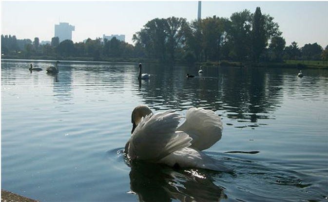
Schwäne sind schon viele Jahre an der Alten Donau heimisch.

Ein anschauliches Bild all dessen kann man aus dem faszinierenden (leider vergriffenen) Buch gewinnen, das der früh verstorbene Wasserbau-Experte Gernot Ladinig herausgegeben hat. Die Alte Donau. Menschen am Wasser. Perspektiven einer Landschaft (Bohmann Verlag) versammelt Hunderte historische Postkarten und Ansichten, zahlreiche alte Landkarten und fundierte Texte über die Alte Donau.