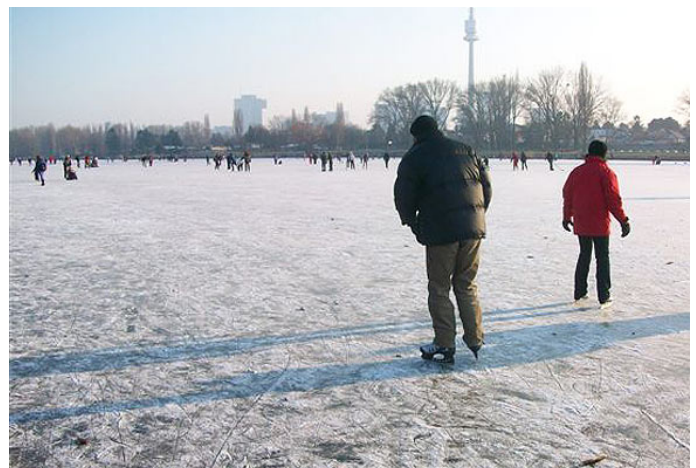
Auch im Winter wird die Alte Donau gerne genützt.

profitabel zu vermarkten, nicht mehr zu übersehen. Wohnen wie am Wörthersee wird man bei Kagran wohl trotzdem nicht. Dafür ist die Alte Donau einfach zu... wienerisch. Und das wird sie hoffentlich auch bleiben.