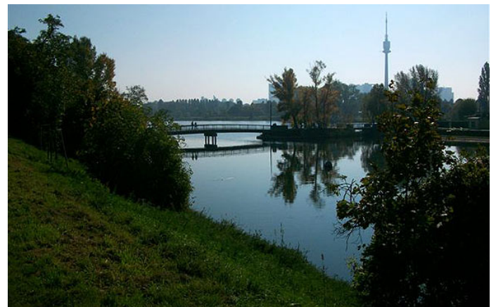
Der Abend senkt sich.

Nach Abschluss der Regulierungsarbeiten im April 1875 ergoss sich die Donau in ihr neues, ihr heutiges, Flussbett. Aus dem früheren Hauptstrom wurde zwischen Floridsdorf und Stadlau ein Altwasser.